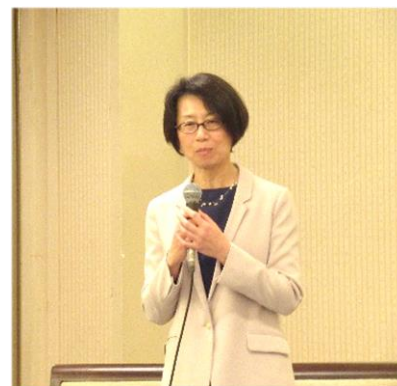
JICA 中国 三角所長